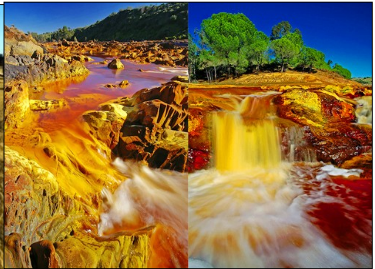
Râul Tinto din Spania

Lung de aproape 100 de kilometri, râul spaniol Tinto își croiește drum prin Munții Sierra Morena către golful Cadiz, trecând prin unul dintre cele mai mari depozite de pirita. Peisajul pare desprins dintr-o altă lume. Cu o mare concentrație de metale grele, râul Tinto este unul dintre cele mai poluate din lume.