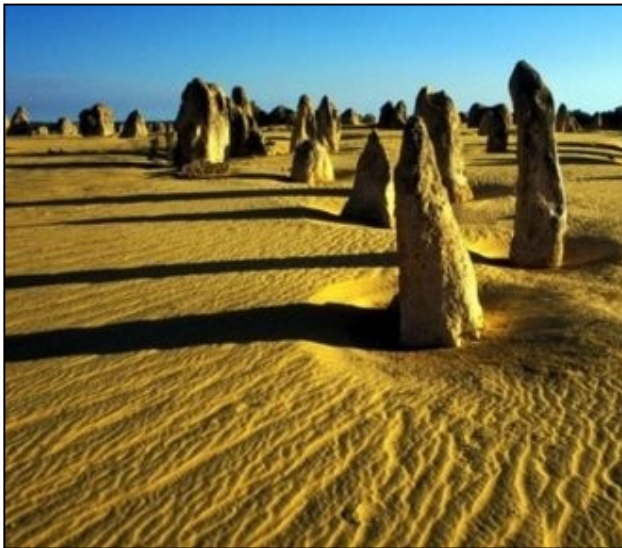
Deșertul Pinnacles din Australia

Enigmaticul deșert Pinnacles , din Parcul Național Nambung, din Australia, constă în mii de piloni din calcar ce se ridică din nisip. Unele formațiuni ajung și până la 4 metri înălțime. De altfel, Australia este renumită pentru formațiunile sale ciudate din piatră