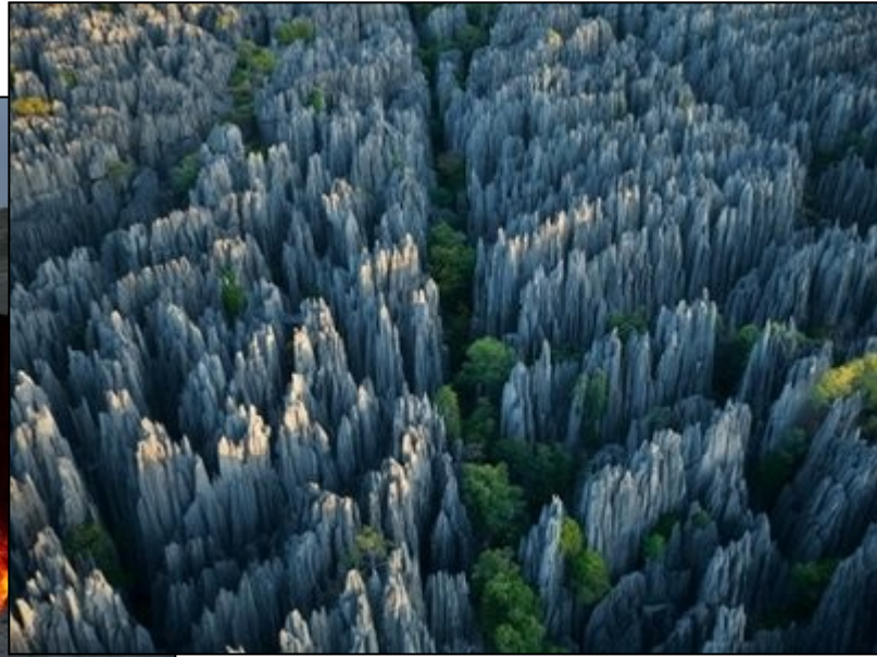
Pădurile de pietre din China

Pădurile de pietre din China acoperă o regiune de 500.000 de kilometri pătrați. Pădurea de pietre Naigu din provincia Yunnan, este protejată de UNESCO din 2007, fiind cea mai spectaculoasă dintre acestea. Regiunea e renumită pentru diversitatea formelor rocilor și culorile acestora.