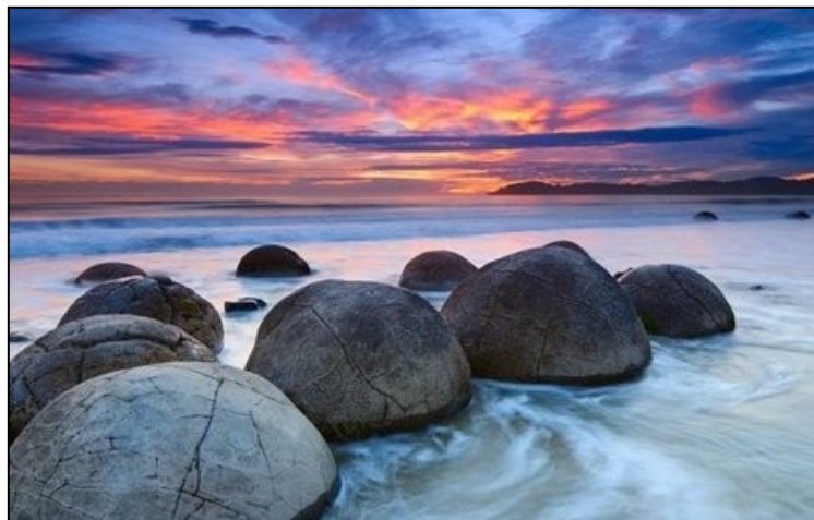
Bolovanii Moeraki din Noua Zeelanda

Bolovanii Moeraki, din Noua Zeelanda , deși în definitiv niște pietre, ce-i drept imense și perfect rotunde, sunt celebri. Oamenii din toate părțile globului vin să-i vada pe plaja Koekohe. Potrivit geologilor, aceste roci de calcit s-au format în urma cu 65 de milioane de ani, pe fundul mării, perioadă care coincide cu un moment de extincție din istoria Pământului, când și dinozaurii au dispărut.